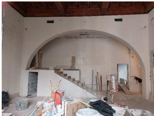
Foto 1_scala di collegamento con la sala ceramiche