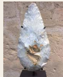
1 Bifacciale, Paleolitico