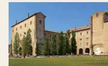
Il Palazzo della Pilotta

Concepito originariamente come contenitore dei servizi della corte farnesiana atto a integrare il sistema delle residenze ducali, il monumentale palazzo della Pilotta ebbe inizio con ogni probabilità intorno al 1583, durante gli ultimi anni del ducato di Ottavio Farnese (1547-1586) su progetto dell'urbinate Francesco Paciotto. I lunghi corridoi erano disposti ortogonalmente a delimitare una vera e propria "cittadella", connessa con il distrutto palazzo Ducale e con quello del Giardino, sito sull'altra sponda del Torrente Parma. Il suo sistema di cortili interni e il parato in rustici mattoni erano destinati a contenere magazzini, scuderie, caserme, nonché una grandiosa sala d'armi poi trasformata in teatro di corte. Il complesso deriva il suo nome dal gioco nobiliare della "pelota" che si praticava nei cortili in particolari occasioni di rappresentanza. Già sede di una selezionata quadreria ducale e di una raccolta libraria in epoca farnesiana, la Pilotta, durante la ducea di Don Filippo di Borbone (1748-1765), ospitò l'Accademia di Belle Arti con la sua collezione artistica, da cui poi avrà origine la Galleria Nazionale, la Biblioteca Palatina, il Museo Archeologico e il Museo Bodoniano. Separati dopo l'Unità d'Italia, questi istituti culturali dal 2016 hanno ritrovato la loro unità, dando vita a un complesso monumentale unico che si apre oggi a un nuovo dialogo con la cittadinanza.