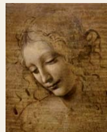
11 Leonardo da Vinci, La Scapiliata, 1492-1501 ca.