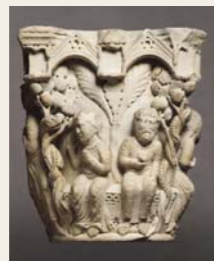
7 Benedetto Antelami, Capitello con Adamo ed Eva, 1178 ca.