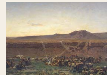
32 Alberto Pasini, Una carovana che pernottò in un'oasi e preparasi alla partenza, 1864