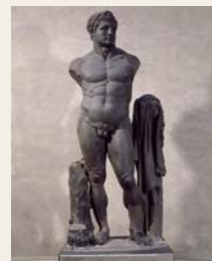
30 Ercole, II sec. d.C.