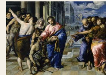
9 El Greco, Guarigione del cieco nato, 1573 - 1576