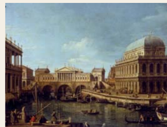
26 Antonio Canal detto il Canaletto, Capriccio con edifici palladiani, 1750 ca.