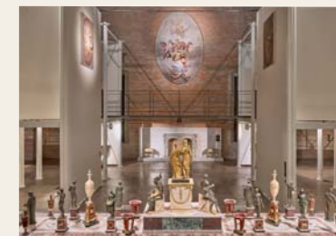
10 Damia Campeny, Trionfo da tavola, 1803