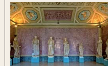
Museo Archeologico Nazionale

Costruito nel 1618, il Farnese è il primo teatro moderno dell'Occidente. Costruito in brevissimo tempo con materiali leggeri come il legno e lo stucco dipinti, nacque per volontà di Ranuccio I per festeggiare con grande sfarzo la sosta di Cosimo II de' Medici a Parma, in occasione di un viaggio a Milano. Esito di una ricerca architettonica nelle corti italiane durata più di un secolo, venne progettato da Giovan Battista Aleotti che ne fece il primo spazio coperto per rappresentazioni, provvisto di un sistema ingegneristico per scenografie mobili. Inaugurato nel 1628, venne utilizzato per le feste e gli spettacoli ducali, in occasione di matrimoni o importanti visite di Stato.