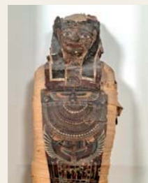
C Mummia di Osoroeris, III-I secolo a.C.