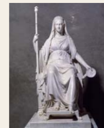
28 Antonio Canova, Maria Luigia d'Austria in veste di Concordia, 1810