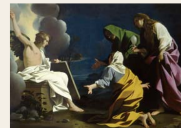
17 Bartolomeo Schedoni, Le Marie al sepolcro, 1613 circa