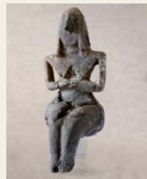
1 Divinità femminile, Neolitico