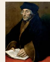
15 Hans Holbein, Erasmo da Rotterdam, 1530 ca.