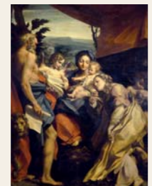
33 Antonio Allegri detto il Correggio, Madonna di san Gerolamo, 1526-1528