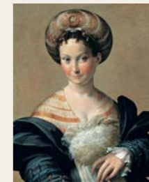
9 Francesco Mazzola detto il Parmigianino, Schiava Turca, 1530