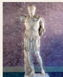
2 Germanico con ritratto di Nerva, I secolo d.C.